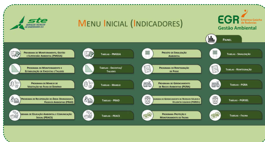
Visualização do painel de indicadores do Projeto Básico de Gestão Ambiental por programa